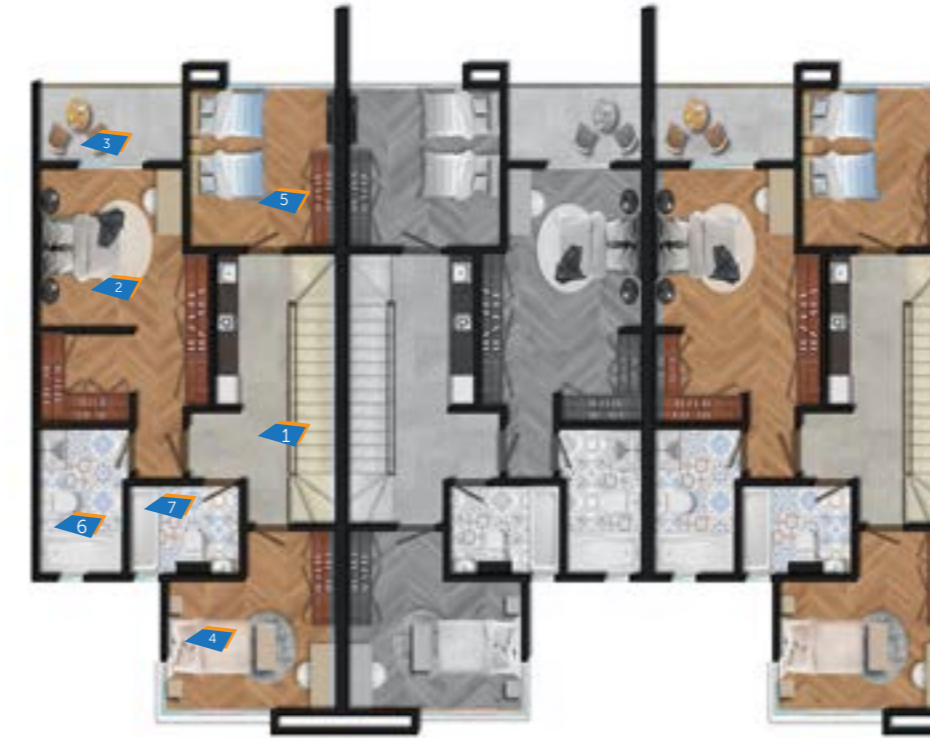
Townhouse A3 (1) First floor