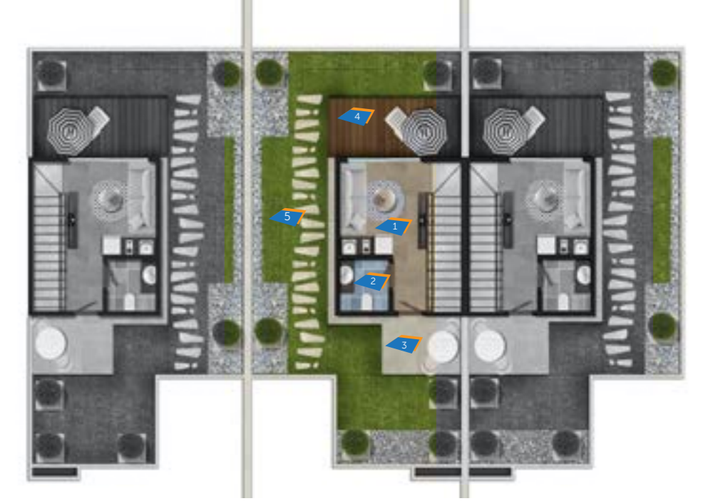
Townhouse A3 (2) Roof