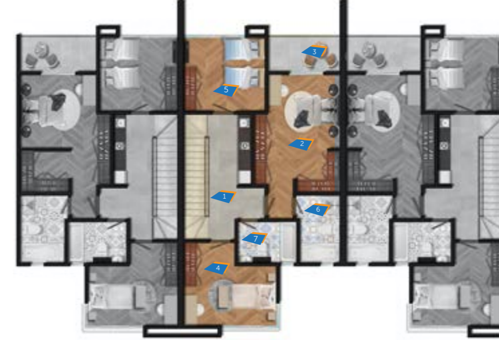
Townhouse A3 (2) First floor