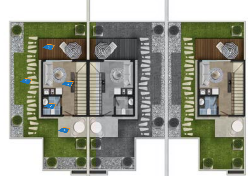
Townhouse A3 (1) Roof